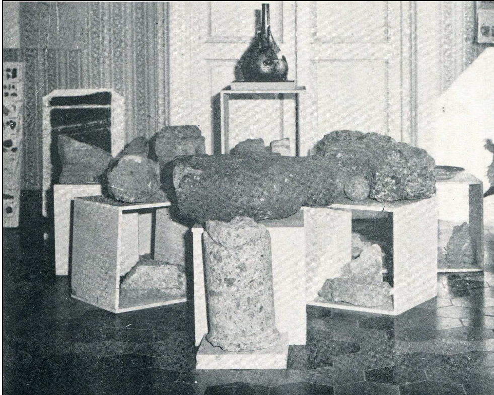
Reperti chiesa matrice

Esso è inoltre molto ricco di acque sorgive, come mostrano il fontanile del Crocefissò , la fontana Bragalla, le polle d'acqua affioranti un po' ovunque sulle pendici del colle e le sorgenti perenni attestate soprattutto sull'altura meridionale.