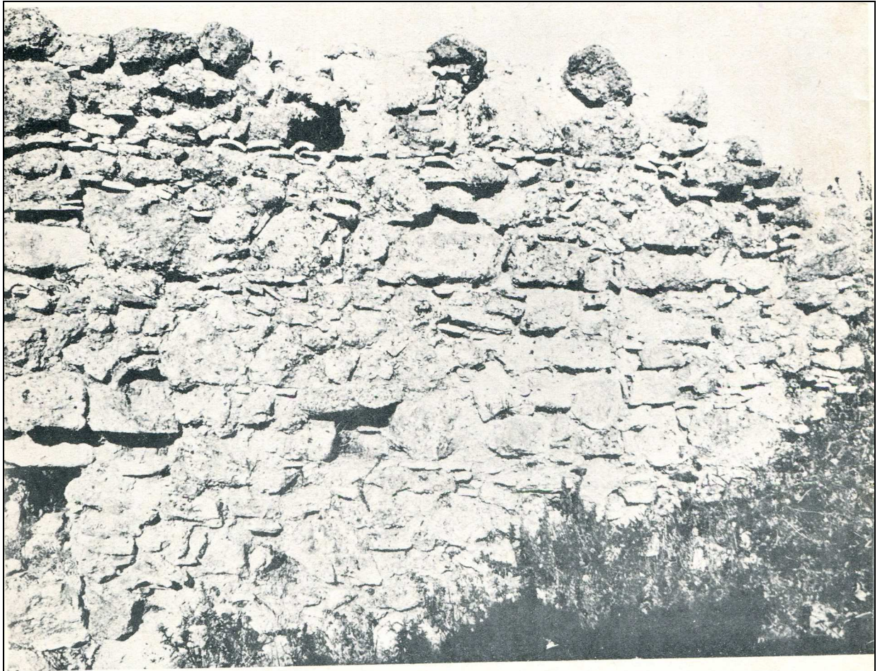
Particolare del muro ovest del castello